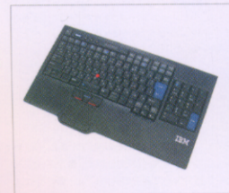
(31P8974) USBキーボード ウルトラナビ付