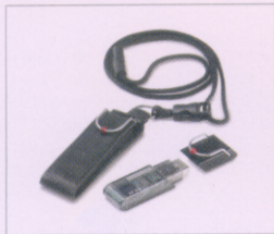
(22P9229) 128MB USB2.0 高速メモリー・スティック