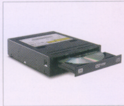
(73P3305) DVD-RAM/RW ドライブ プラス III (DVDスーパーマルチドライブ)