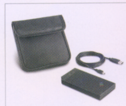
(22P7196) ポータブル40GB USB2.0 ハードディスク with Rescue & Recovery